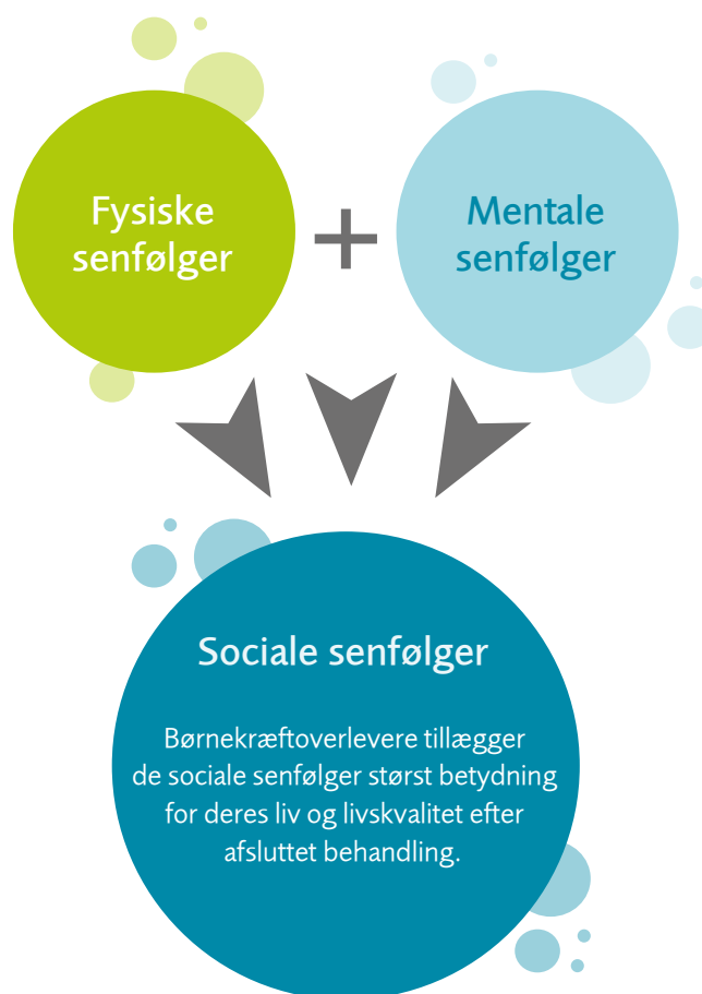
Figur 1: Figuren illustrerer, at sociale senfølger er genereret af fysiske og/eller mentale senfølger. Figuren illustrerer ligeledes, at det er den samlede sum af senfølgerne, der tillægges størst betydning af børnekræftoverleverne og kommer til udtryk som sociale senfølger.

Den samlede sum af senfølgernes betydning kommer til udtryk som sociale konsekvenser for livet efter afsluttet behandling. Disse sociale konsekvenser er lig med det, børnekræftoverleverne selv betegner som sociale senfølger. Dette illustreres i figur 1 til højre.