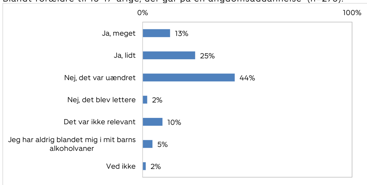
Figur 2. Tænk tilbage på dit barns start på en ungdomsuddannelse. Blev det sværere for dig at blande dig i dit barns alkoholvaner, da det startede på en ungdomsuddannelse? Blandt forældre til 15-17-årige, der går på en ungdomsuddannelse 1 (n=275).

Figur 2 viser, at næsten 4 ud af 10 forældre (38 %) oplevede, at det blev sværere at blande sig i deres 15-17-årige barns alkoholvaner, da det startede på en ungdomsuddannelse. 44 % oplevede situationen som uændret, mens ganske få oplevede, at det blev lettere at blande sig i barnets alkoholvaner (2 %).