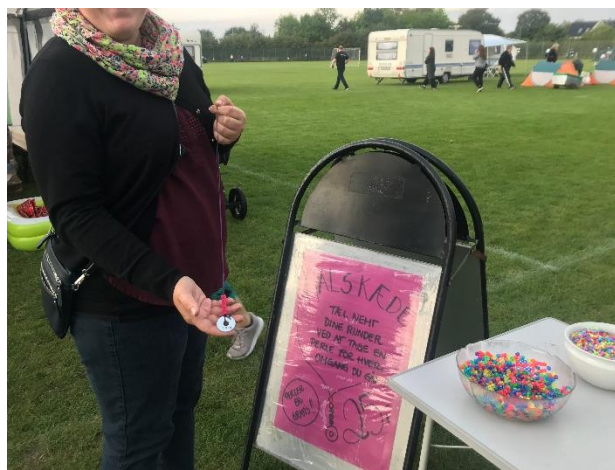
Salg af hjemmelavet halskæde: Forevig dit antal runder, ved at lave en fin halskæde, med en perle fra hver runde gået. SFL Frederiksund 2019.