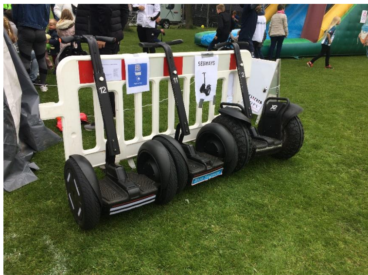
Holdfundraising ved leje af segway. SFL Esbjerg 2019